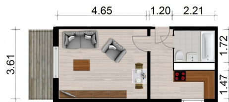
Maße sind ca. Maße!